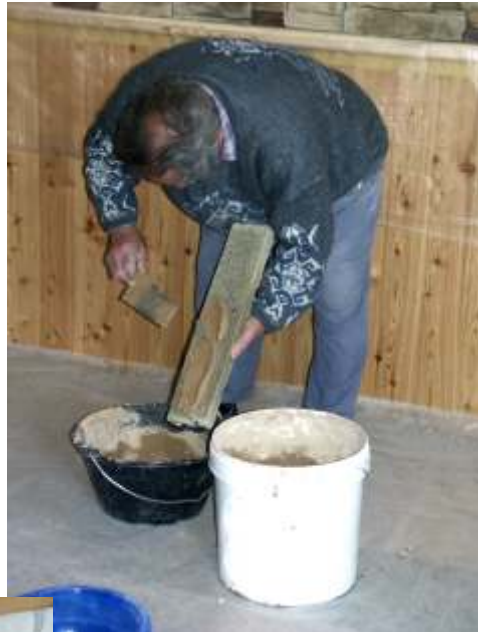
Appliquer le ciment colle sur le dos de la pierre