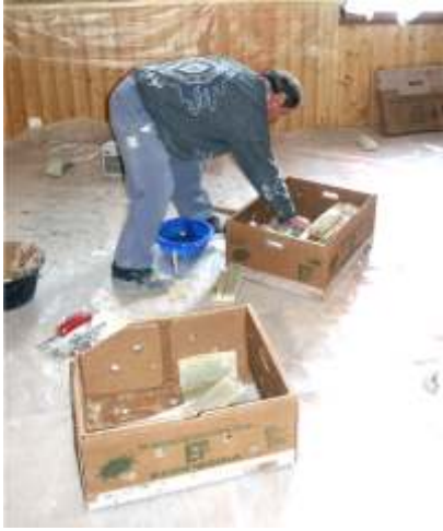
La pierre reconstituée et livrée en carton.