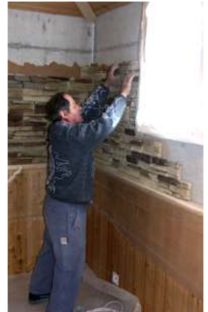
Poser le pierre sur la surface