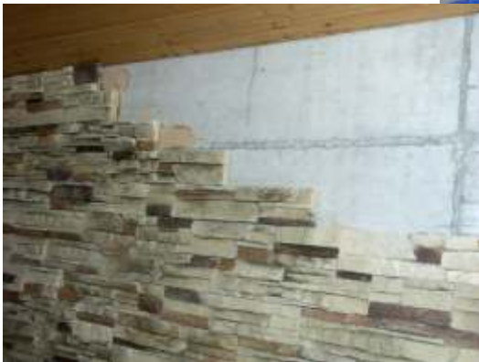
Pose des plaquette de bas en haut. Les longueurs des plaquettes sont panachées par carton